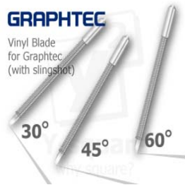
Boite de 5 lames adaptables pour plotter Graphtec CB09 79,90 €