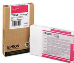
Cartouche d'encre Artainium pour Epson D88, 3000, 4400, 4450 45,00 €