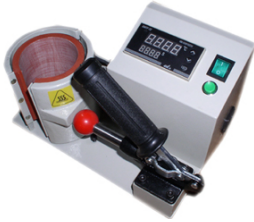
Presse à transfert pour mugs 349,00 €

Vous pourriez également être intéressé par :