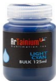
Artainium UV+ - Encre à Sublimation polyester 75,00 €