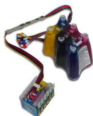
Kit d'encrage Artainium pour textiles et supports en polyester 340,00 €