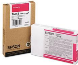
Cartouche d'encre Artainium pour Epson 4000 97,00 €