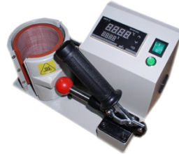
Presse à transfert pour mugs 249,00 €